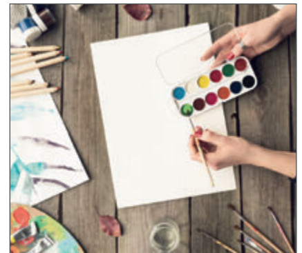
Mit dem eigenen Video zum Internet-Star? Musik- und Malworkshops für Jugendliche.