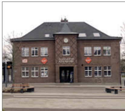
Wenn der Stoff nie ausgeht Hobby-Näherinnen treffen sich jeden Freitag.