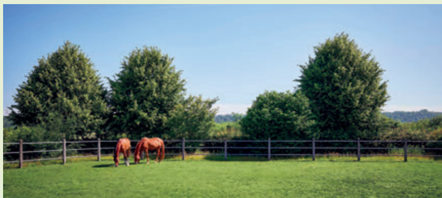
▲ Viel Platz auf den Weiden haben die Springpferde.