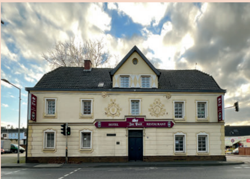
▲ Ende des 19. Jahrhunderts entstand der Gasthof „Zur Post“.