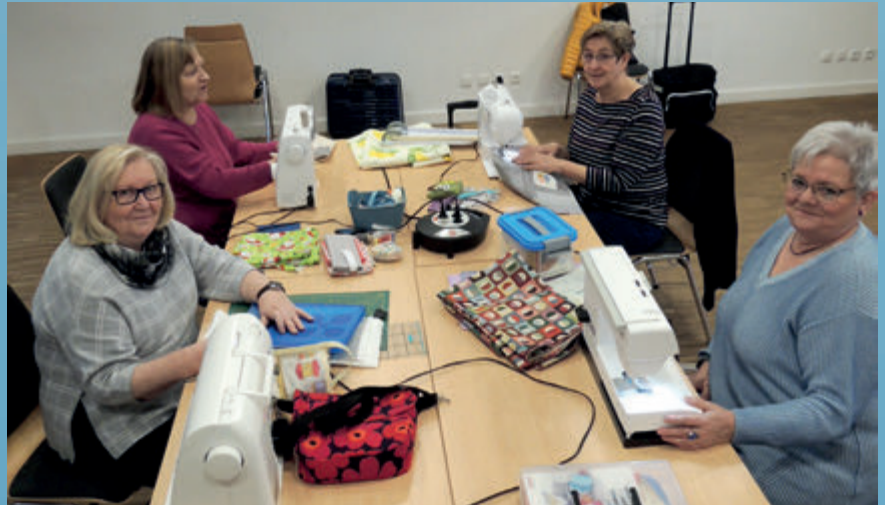
▲ Über neue Hobby-Schneiderinnen freut sich die Nähgruppe.