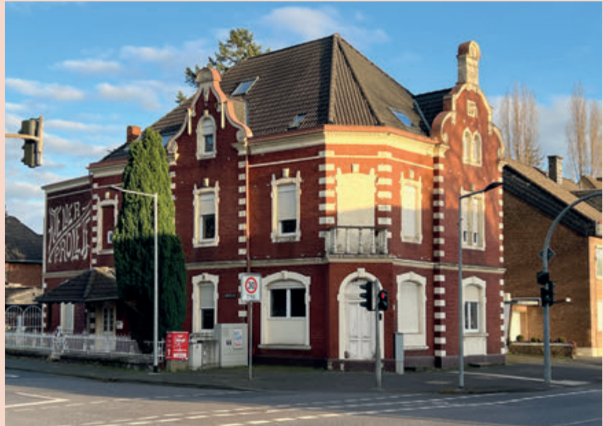
▲ Jeder kennt das Haus Roleff mit seiner markanten Fassade.

„Bürgermitwirkung“ gibt es in Quadrath-Ichendorf schon seit langer Zeit. Viele engagierte Bürgerinnen und Bürger treffen sich immer wieder in den unterschiedlichsten Zusammenhängen: Das KulturWerk initiiert kulturelle Events, die Website www.mein-quadrath-ichendorf.de und die Stadtteilzeitung „Querstrich“ berichten darüber und über vieles andere, der Budgetbeirat unterstützt Projekte finanziell, mit dem Kultur- und Integrationsbahnhof Gleis11 haben wir ein Zentrum mit enthusiastischen Mitarbeiterinnen. Von der großen Zahl an Vereinen müssen wir gar nicht reden. Das Bürgerbeteiligungsforum QI hat sich im letzten Herbst zusammengefunden. Für 2021 mussten wir schnell ein Projekt finden, das den Menschen vor Ort zugute kommt. Wir entschieden uns für drei Smiley-Tafeln, die den Verkehrsfluss auf der Sandstraße und der Straße Auf der Helle ein bisschen fußgängerfreundlicher gestalten wollen. Für 2022 haben wir ein umfangreiches Projekt vor: In QI gibt es eine Reihe von