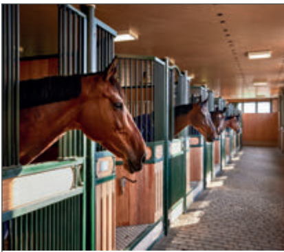
Ein Paradies für Commander Bond Neues Reitsportzentrum auf der Fischbachhöhe.

Im Mai wird im und um das Gleis11 gefeiert. S. 11