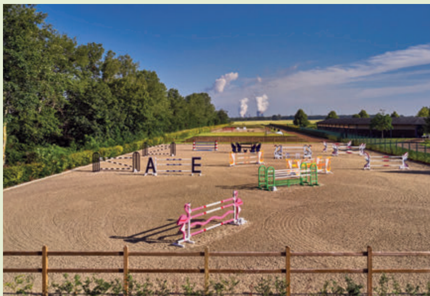
▲ Auf der alten Schlenderhan-Rennbahn ist ein Springreit-Parcours entstanden.

hinzu: „Zuvor auch mit der 17jährigen Vabima. Aber die geht jetzt in die Zucht.“ Übrigens: Wenn Sie sich fragen, was die Abkürzung FBH im Unternehmensnamen bedeutet... Ganz einfach: Die Buchstaben sind die Abkürzung für „Fischbachhöhe“. Nähere Infos unter www.fbh-equestrian.center . bb