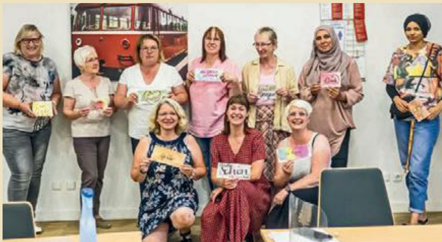
▲ Kunstvolle Karten fertigten die Teilnehmerinnen beim Handlettering-Workshop.