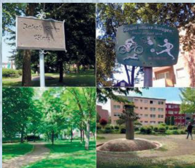
▲ Viele Bewegungsmöglichkeiten wird es künftig auf dem Jakob-Bühr-Platz geben.

nen, einen Pflasterteppich, eine Sitzgelegenheit mit Leuchte unter dem Titel „Wohnzimmer“, Pflanzteppiche mit Gräsern, Farnen und Stauden sowie einen Weg mit wassergebundener Oberfläche, der auch mit Rollstühlen oder Kinderwagen bequem befahrbar sein wird. Für den Spielplatz an der Robert-Koch-Straße sind Wackelblätter, eine Nestschaukel mit synthetischem und wassergebundenes Fallschutz, eine Integrationswippe, Sandspielflächen und ein unterfahrbarer Sandspieltisch vorgesehen. Eine naturnahe Bepflanzung mit Steinkreis, Findlingen, Mulchflächen und bequeme Sitzgelegenheiten laden zum Verweilen ein. Auch was die Gestaltung des Umfelds des Kulturbahnhofs für Außengastronomie und Veranstaltungen betrifft, tut sich was. „Derzeit läuft die Planung für die Ausführung und Vorbereitung zur öffentlichen Ausschreibung“, fügt der Ingenieur hinzu. Auch auf überregionaler Ebene ernteten die geplanten Bauprojekte jetzt viel Lob. Während einer Tagung des Städtenetz NRW, in dem alle Kommunen, die im Rahmen des Programms „Soziale Stadt“ gefördert werden, zusammengefasst sind, stand die Entwicklung Quadrath-Ichendorfs im Mittelpunkt. Bei einem Stadtteilspaziergang erläuterte der Raumplaner den Kolleginnen und Kollegen anderer Kommunen die städtebaulichen Projekte. Die auswärtigen Fachleute bezeichneten die Bergheimer Pläne als „vorbildlich“. Nähere Informationen zu den Baumaßnahmen erteilt Hasan Yurdaer unter der Rufnummer 02271/568 98 96 oder per Mail unter hasan.yurdaer@eg-bm.de . bb