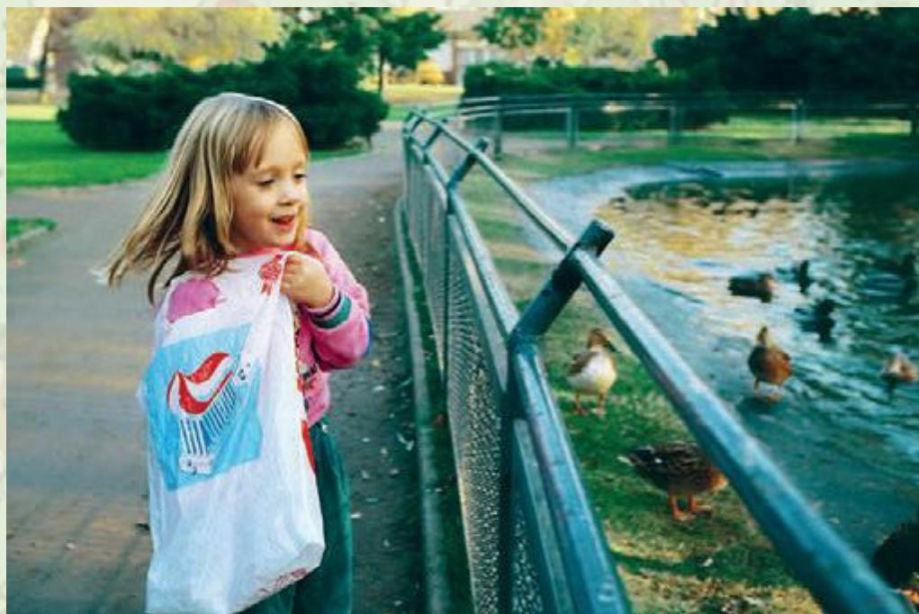
▲ Vor 30 Jahren kamen die Kinder mit Tüten voller Brot, um die Tiere zu füttern. Heute wissen die meisten, dass es verboten ist.

Gehege einen neuen Spielplatz. Im Laufe der letzten Jahre konnten fast alle anfallenden Tätigkeiten mit eigenem Personal kostengünstig übernommen werden, so dass der Förderverein heute gut da steht. Selbst die Betreuung der Tiere im Tierpark wird durch eigens geschultes Personal vorgenommen. Alljährlich veranstaltet der Förderverein drei attraktive Feste, die mittlerweile zum