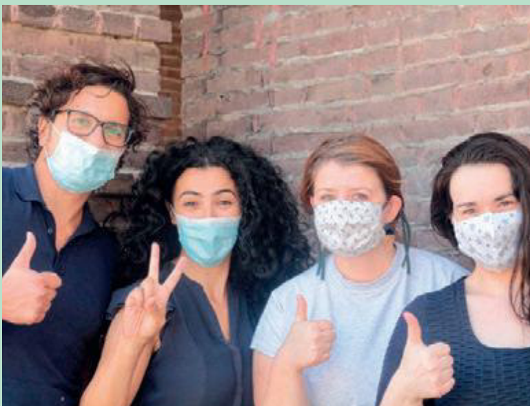
▲ Freut sich über die Masken und das Engagement: Das Team von Gleis 11.