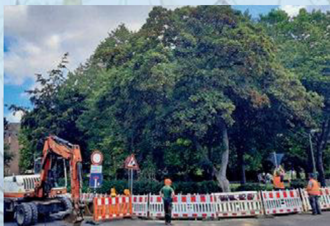
▲ Noch sind die Straßenarbeiten an der Ahestraße/Ecke Robert-Koch-Straße nicht abgeschlossen.

nen, einen Pflasterteppich, eine Sitzgelegenheit mit Leuchte unter dem Titel „Wohnzimmer“, Pflanzteppiche mit Gräsern, Farnen und Stauden sowie einen Weg mit wassergebundener Oberfläche, der auch mit Rollstühlen oder Kinderwagen bequem befahrbar sein wird. Für den Spielplatz an der Robert-Koch-Straße sind Wackelblätter, eine Nestschaukel mit synthetischem und wassergebundenes Fallschutz, eine Integrationswippe, Sandspielflächen und ein unterfahrbarer Sandspieltisch vorgesehen. Eine naturnahe Bepflanzung mit Steinkreis, Findlingen, Mulchflächen und bequeme Sitzgelegenheiten laden zum Verweilen ein. Auch was die Gestaltung des Umfelds des Kulturbahnhofs für Außengastronomie und Veranstaltungen betrifft, tut sich was. „Derzeit läuft die Planung für die Ausführung und Vorbereitung zur öffentlichen Ausschreibung“, fügt der Ingenieur hinzu. Auch auf überregionaler Ebene ernteten die geplanten Bauprojekte jetzt viel Lob. Während einer Tagung des Städtenetz NRW, in dem alle Kommunen, die im Rahmen des Programms „Soziale Stadt“ gefördert werden, zusammengefasst sind, stand die Entwicklung Quadrath-Ichendorfs im Mittelpunkt. Bei einem Stadtteilspaziergang erläuterte der Raumplaner den Kolleginnen und Kollegen anderer Kommunen die städtebaulichen Projekte. Die auswärtigen Fachleute bezeichneten die Bergheimer Pläne als „vorbildlich“. Nähere Informationen zu den Baumaßnahmen erteilt Hasan Yurdaer unter der Rufnummer 02271/568 98 96 oder per Mail unter hasan.yurdaer@eg-bm.de . bb