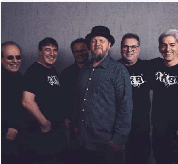
Veranstalter: EG BM gGmbH, Foto: Wolfgang Härtel