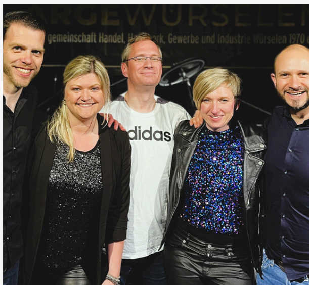
Veranstalter: Flashback Zero, Foto: Sabine Dute