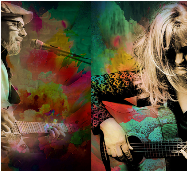
Veranstalter: BM.CULTURA