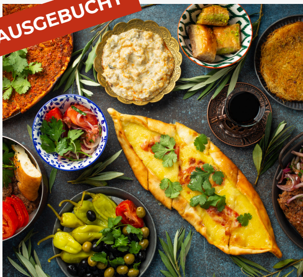
Veranstalter: Give e.V., Foto: Olenayeromenkophotos