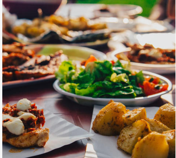
Veranstalter: Give e.V.

Der Give e.V. lädt Sie ein. Freuen Sie sich auf den interkulturellen Abend und erleben Sie hautnah wie gemeinsam das Fasten während des Ramadans gebrochen wird. Nach einer Begrüßung folgt ein Dialog in den Religionen mit Podiumsredner:innen. Um 19:40 Uhr wird gemeinsam das Fasten gebrochen. Die Teilnahme ist kostenlos. Anmeldung unter: give.ev.kerpen@gmail.com oder 0177 / 89 28 602 (Murat Gök)